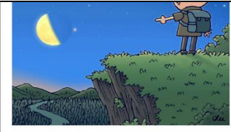
“月掩火星” 现夜空 新华社发 徐骏 作

联系电话:15953537201 通讯地址:襄城县循环经济产业集聚区黄洋铜业有限公司厂区内 7.环境影响评价单位 评价单位:河南咏蓝环境科技有限公司 联系电话:0374-4399338 通讯地址:河南省许昌市魏文路信通金融中心D栋1605室 特此公告! 襄城县永卓粘和剂有限公司 2022年7月19日