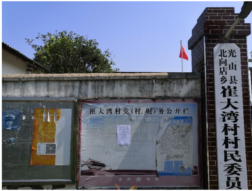
图3.2-4.3 现场公示照片（崔大湾村）