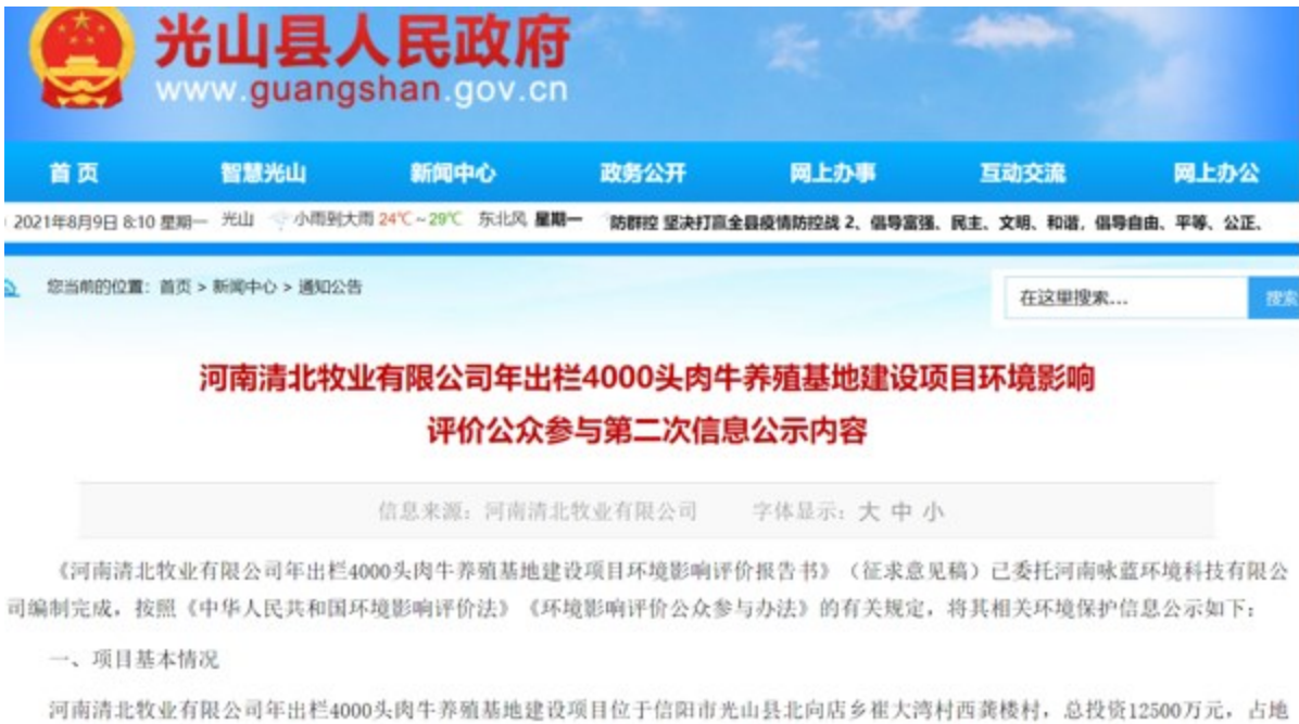
图3.2-1 征求意见稿公示截图（第二次公示）

载体选取的符合性分析：选取在建设项目所在地网络平台光山县人民政府网站进行网上公示，符合《环境影响评价公众参与办法》（生态环境部令 第4号）中通过网络平台公开，且持续公开期限不得少于10个工作日的要求。