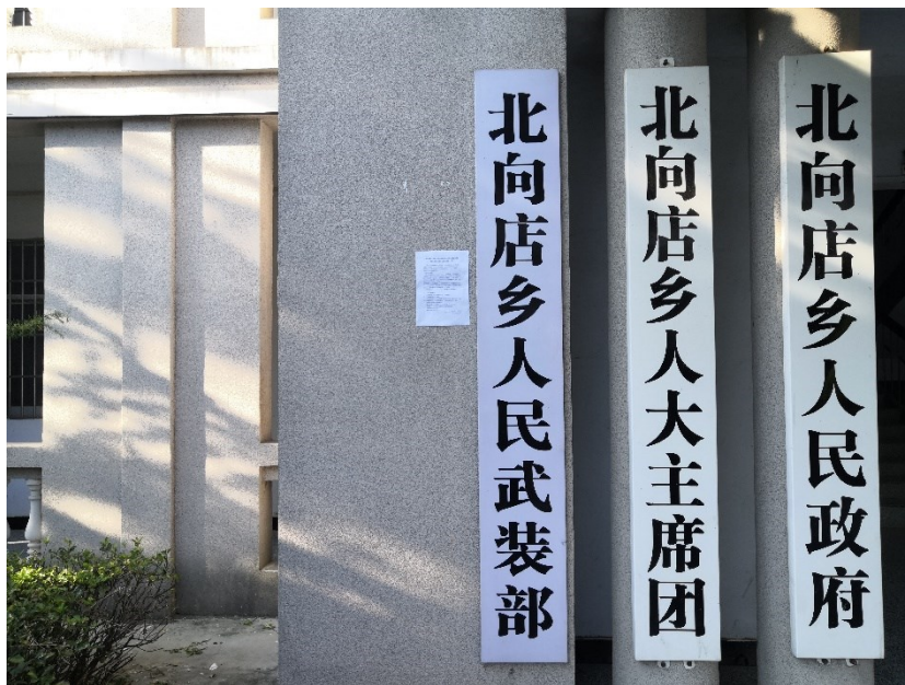
图3.2-4.6 现场公示照片（北向店乡）

张贴区域选取的符合性分析：选取项目评价范围内崔大湾村、代湾村、大李湾、北向店乡及附近村民组等主要敏感点的公告栏处张贴公示，符合《环境影响评价公众参与办法》（生态环境部令 第4号）中在建设项目所在地公众易于知悉的场所张贴公