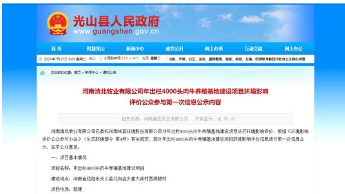
图2.2-1 项目首次公示截图

在建设项目所在地网络平台光山县人民政府进行网上公示，公示网址： http://www.guangshan.gov.cn/news/tzgg/2021-06-18/73850.html ，公示时间为2021年6月18日，项目首次公示截图见图2.2-1。