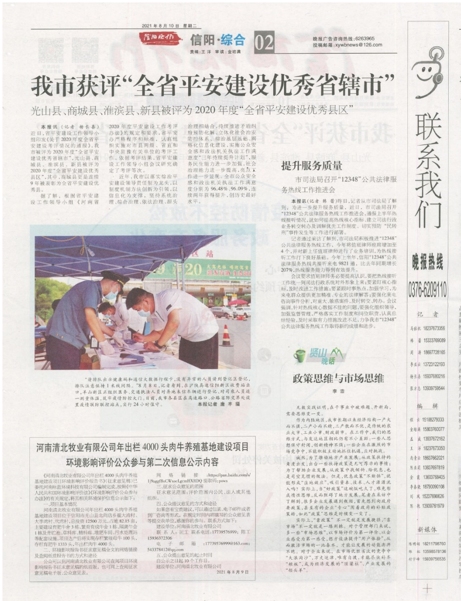
图3.2-3 第二次报纸公示照片

载体选取的符合性分析：通过建设项目所在地公众易于接触的报纸《信阳晚报》进行报纸公示，符合《环境影响评价公众参与办法》（生态环境部令 第4号）中通过建设项目所在地公众易于接触的报纸公开，且在征求意见的10个工作日内公开信息不得少于2次的要求。