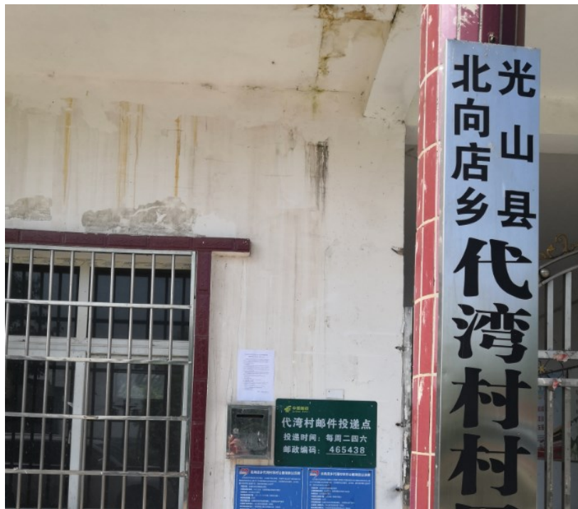
图3.2-4.4 现场公示照片（代湾村）