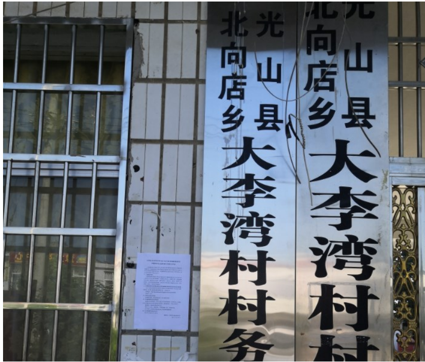
图3.2-4.5 现场公示照片（大李湾村）