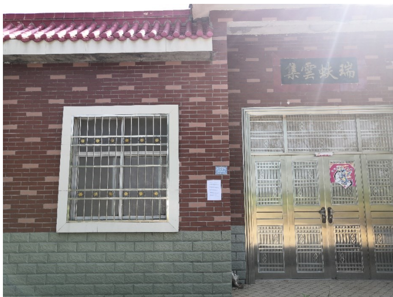
图3.2-4.1 现场公示照片（附近村民组）

湾、代湾村、北向店乡人民政府及附近村民组等敏感点，张贴时间为2021年8月5日，张贴公示照片见图3.2-4。